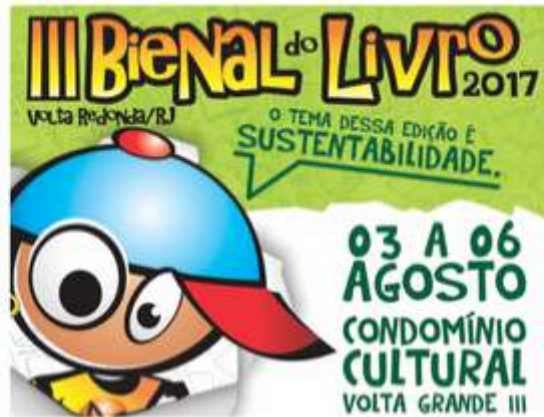
III Bienal do Livro de Volta Redonda

A III Bienal do Livro começa nesta quinta-feira (3) e segue até domingo (6), em Volta Redonda, RJ. Com o tema "Sustentabilidade", o evento vai contar com diversas palestras sobre educação, cultura e meio ambiente. A edição deste ano, 2017, será realizada na Condomínio Cultural, na Rua Sargento Paulo Moreira, nº 248, no bairro Volta Grande III. O horário de funcionamento em todos os dias é de 9h30 às 22h. A entrada é gratuita e a classificação é livre.